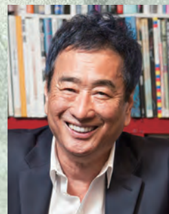
【プレトック】 三枝成彰

【管弦楽】 ジャパン・ヴィルトゥオーゾ・シンフォニー・オーケストラ 企画構成 / 三枝成彰、大友直人