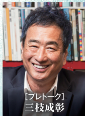
【プレトーク】 三枝成彰