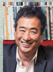
[ブレーク] 三枝成彰

[管弦楽] ジャパン・ヴァルトウオーゾ・シンフォニー・オーケストラ 企画構成/三枝成彰、大友直人