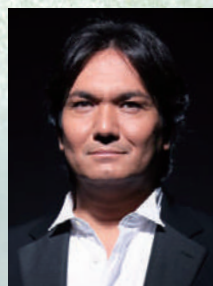
[テノール] ジョン・健・スツツォ