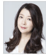
仲道郁代 *Kiyotaka Saito