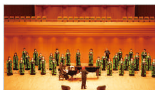
神楽坂女声合唱団