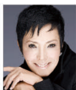
池畑慎之介 (ピーター)