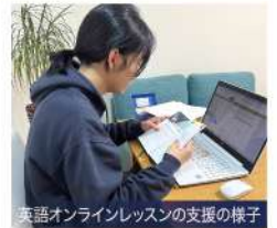
英語オンラインレッスンの支援の様子