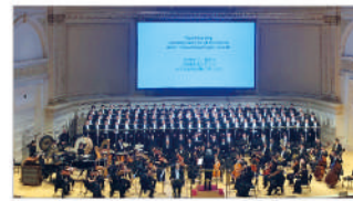
六本木男声合唱団ZIG-ZAG