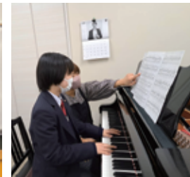
ピアノ教室の支援の様子